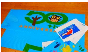
今年度制作の様子