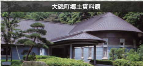
大磯町郷土資料館

大磯が別荘地として発展した明治以降の近現代史を中心としたテーマで展示紹介しています。