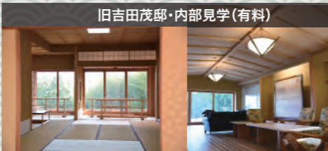
旧吉田茂邸・内部見学(有料)

戦後初の内閣総理大臣を務めた吉田茂が晩年を過ごした本邸を火事で焼失。その後復元し、平成29年4月より公開しています。