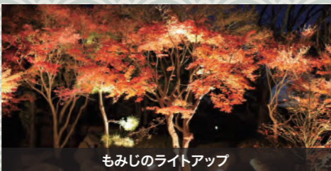
もみじのライトアップ