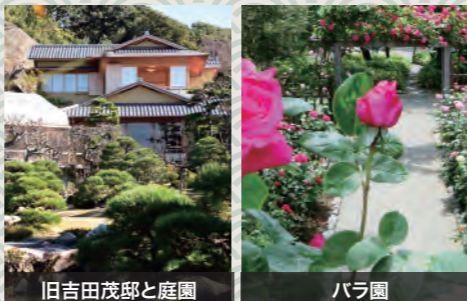
旧吉田茂邸と庭園