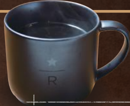
ディカフェ コスタリカ ハシエンダ アルサシア 620円(税別)

スターバックス コーヒー 代沢5丁目店 下北沢駅南西口 徒歩9分 世田谷区 代沢5-8-13 TEL 03-5431-5250 営業 7:30~22:00 休 不定休