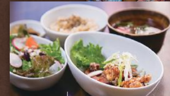
平飼い鶏のぷりぷり唐揚げ(4個) & ご飯セット(玄米 or 白米) 1,400円(税込み)