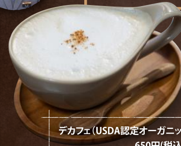
デカフェ(USDA認定オーガニック) 650円(税込み)

とてもノンカフェインとは思えないほど味わい深く、柔らかくて優しいデカフェ(USDA認定オーガニック)。平飼いの鶏の唐揚げはぷりぷりで玄米とよく合います。有機栽培や自然農法の野菜などに優しい食材がこだわりです。