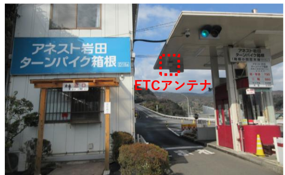
小田原料金所(箱根小田原本線)