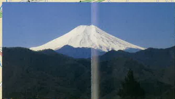
大月市境手前からの富士山の眺望