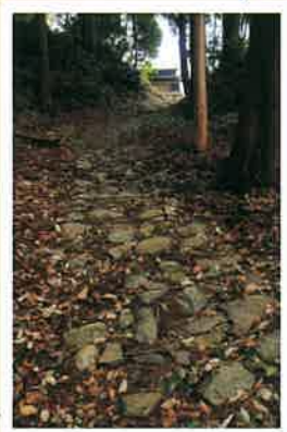
旧甲州街道石畳 往時の風情感じる石畳道。