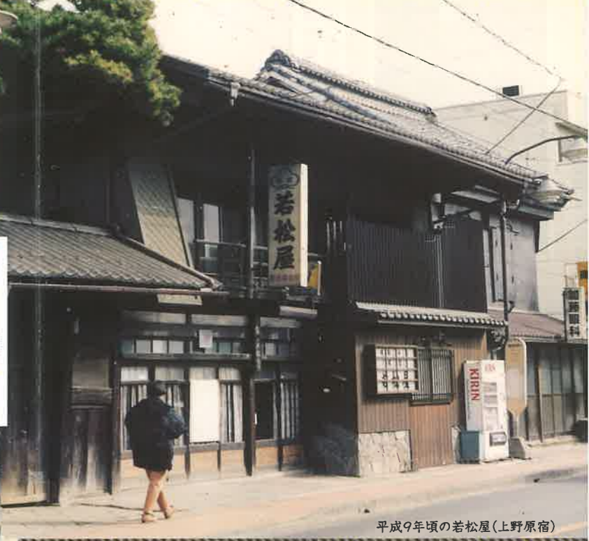
平成9年頃の若松屋(上野原宿)