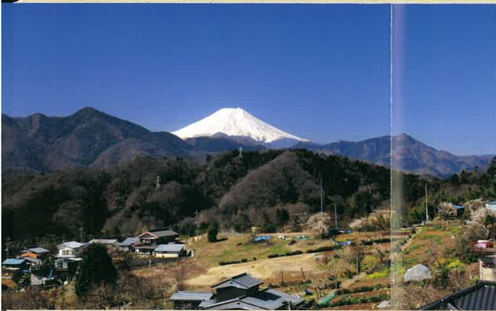
犬目宿から望む富士山